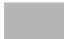
15 52885 Platin Metallic