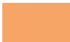
16 52222 Bronze